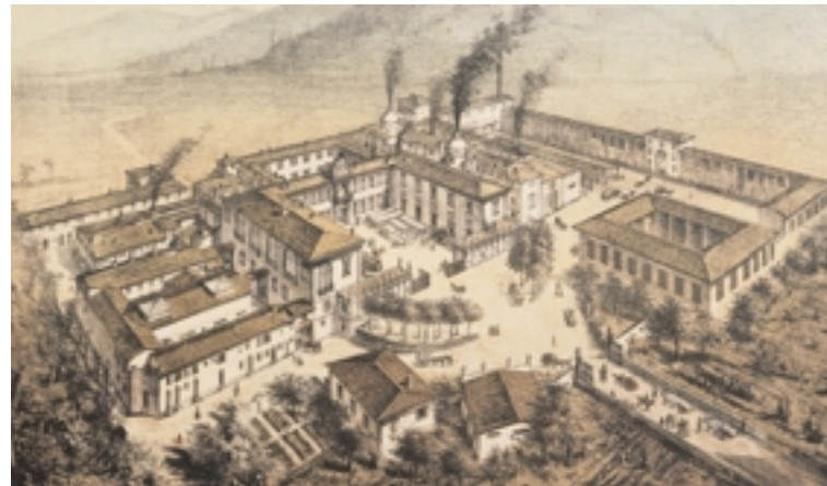
Veduta dell'antica Manifattura di Doccia, 1865 circa

La Manifattura fondata da Carlo Ginori nel 1737 è anche nota con il nome della località in cui nacque, cioè Doccia. Toponimo piuttosto diffuso in Toscana, significa 'condotta per l'acqua' e, nel nostro caso, identifica un luogo del territorio di Sesto Fiorentino situato ai piedi del Monte Acuto, nei pressi di Colonnata. I Ginori erano originari della vicina Calenzano e da secoli possedevano terre nella pianura a nord di Firenze, tra le colline preappenniniche e l'Arno. A Doccia, in posizione panoramica, sorgeva la villa in prossimità della quale si sviluppò la gloriosa produzione ceramica. Nel 1958 l'attività si trasferì in un nuovo stabilimento, aperto a Sesto nel 1950 e tuttora operante.