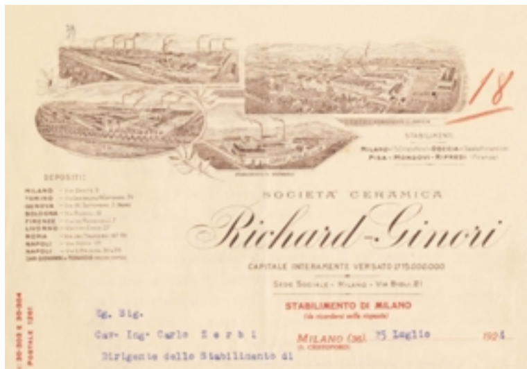
Carta intestata della Società Ceramica Richard-Ginori , 1924

Il fondo conservato dal Museo Richard-Ginori va quindi pensato come una serie dell'archivio domestico Ginori, che ha avuto vita parallela, quasi indipendente da esso, solo dalla metà dell'Ottocento, in corrispondenza del maggior ruolo assunto dalla figura del direttore di stabilimento. L'archivio dell'impresa ha preso vita completamente svincolata da quella dell'ente produttore originario solo nel momento della nascita della Società ceramica Richard-Ginori . Negli anni Quaranta del Novecento l'archivio di famiglia è stato riordinato dal marchese Leonardo il quale ha compiuto una riorganizzazione completa, con la creazione delle serie 'per teste'. Così, gli atti dalla fondazione della Manifattura si trovano ora nelle serie interne a quelle delle sezioni relative a ciascun capofamiglia, dal fondatore in poi.