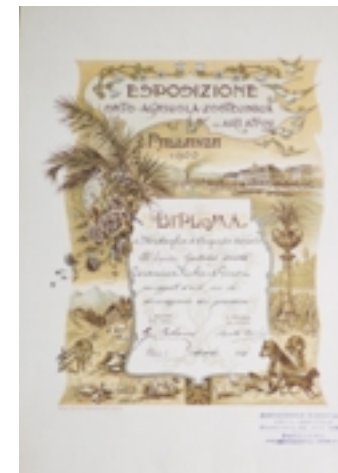
Diploma dell' Esposizione ortogricola-zootecnica ed arti affini di Pallanza, 1900

gistrazione del nominativo, della quantità e tipologia del pezzo; è solo in questo modo che si possono rintracciare notizie degli affari con la Casa Reale, a far data dall'esposizione di Palermo del 1891. Della contabilità rimane uno spezzone di serie di registri di magazzino consecutivi dal 1801 al 1815, mentre di carte di appoggio c'è poco, come è consueto negli archivi di impresa, poveri di atti non più utili all'amministrazione corrente o la cui conservazione non fosse obbligatoria.